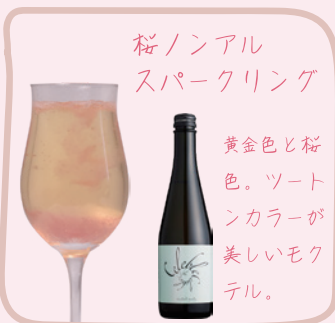
桜ノンアル スパークリング