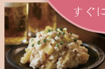
たくあんやナッツで食感をプラス