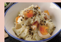
コショウたっぷりポテトサラダ