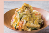
ポテトサラダ レリッシュ風味