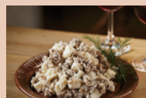
ひき肉やベーコンで食べ応え UP