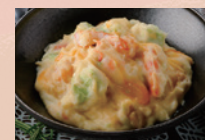
エビとマッシュポテトのサラダ