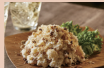
花椒(ホアジャオ)で大人のポテサラ